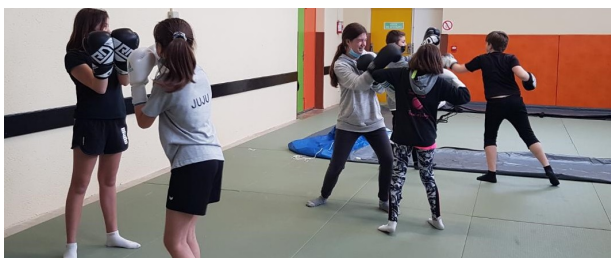
Initiation à la boxe et à l'arc touch, au programme des activités ados des vacances de février, Séjour dans le Poitou avec journée au Futuroscope,